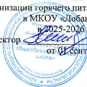
График посещения школьной столовой МКОУ «Лобакинская СОШ» 2025-2026 учебный год